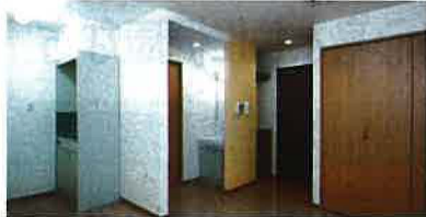
Aタイプ居間(キッチン・洗面・トイレ付)