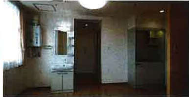
Cタイプ居間(キッチン・浴室・洗面・トイレ付)